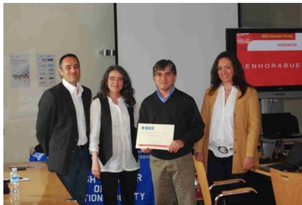
Imagen de los ganadores en el momento de presentación e trabajos y entrega de los premios.

¡Enhorabuena a los premiados y a sus respectivos directores!