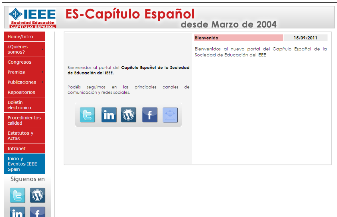
Imagen de la página de inicio de nuestra página Web

http://www.ieec.uned.es/WebIEEE/Cap_esp/IEEE_Cap_esp.asp