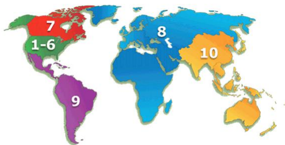
División en regiones del IEEE – En azul se remarca la región 8.

La Región 8 aglutina a todos los países de Europa, Oriente Medio y África. Comprende más de 470 capítulos de las 38 sociedades del IEEE.