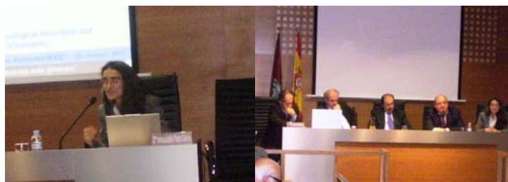
Imágenes de la impartición de la ponencia y participación en la mesa redonda-coloquio.

Desde estas líneas queremos agradecer a la Real Academia de Ingeniería y a su presidente, D. Anibal R. Figueiras Vidal la acogida y apoyo brindados al Capítulo.