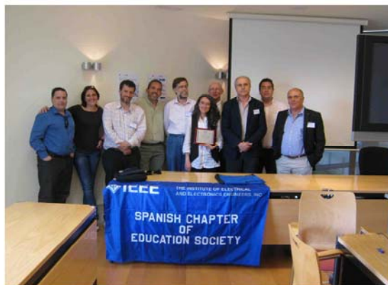
Placa entregada en reconocimiento al premio y foto conjunta de miembros del capítulo en la reunión de Mayo de 2010.